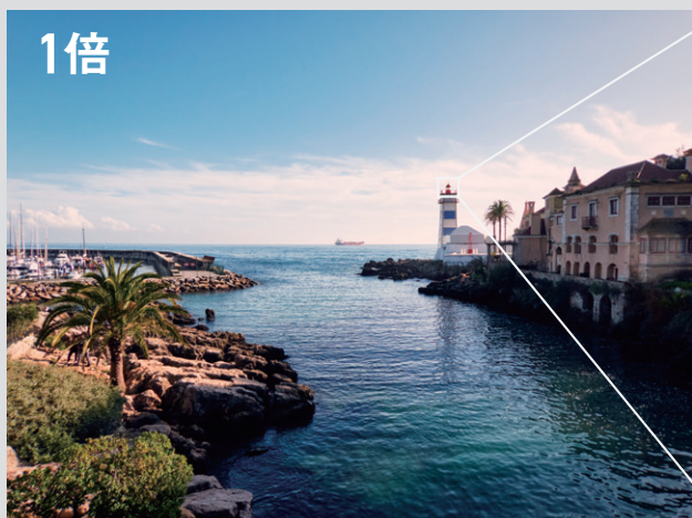
TZ99 / 24mm (35mm判換算) , 1/800sec, F3.3, ISO80