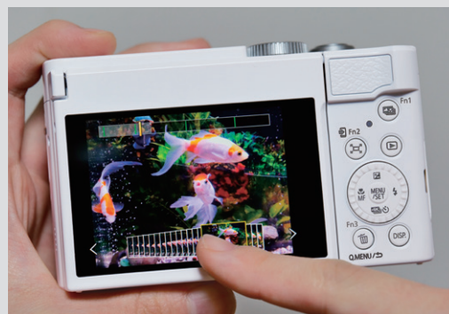
●画像は効果を説明するためのイメージです。