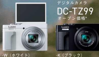
デジタルカメラ DC-TZ99 オープン価格*