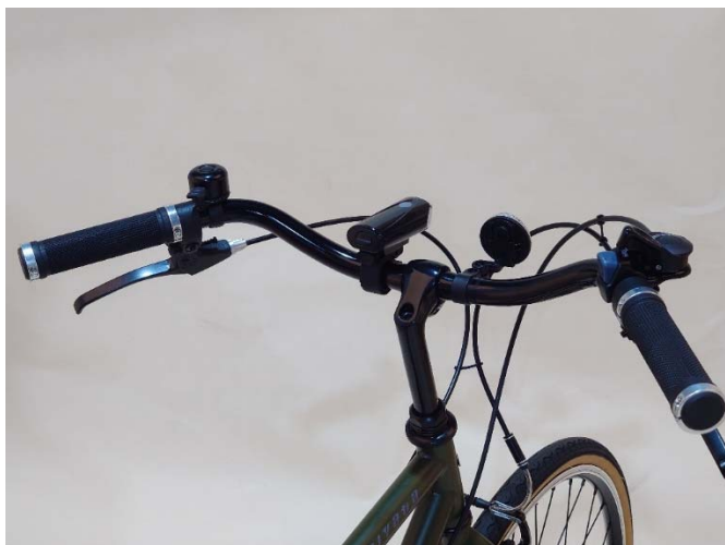
手前に曲がったカモメ形状のハンドルバー（幅 560mm）