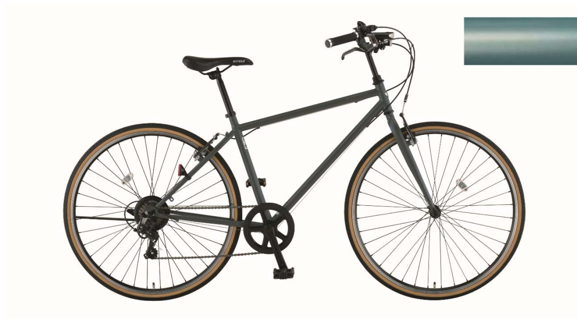
ハーフマツスレートブルー(AB71)