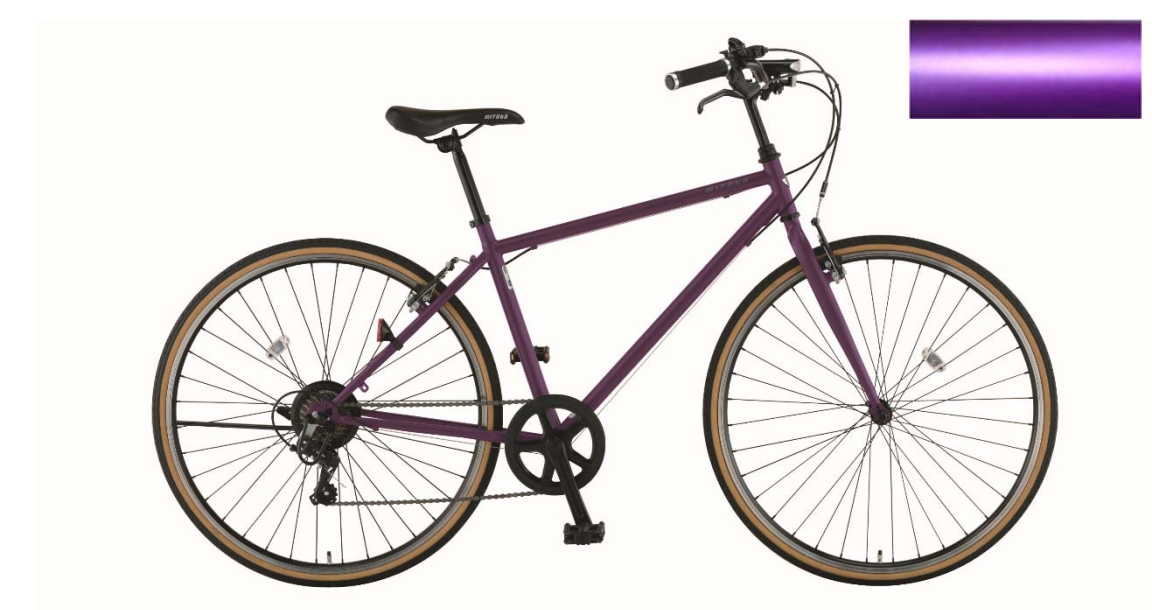
ハーフマツピオニーパープル(OM40)