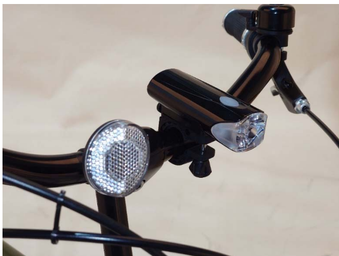
バッテリーライトを標準装備（最大光度 1,000 カンデラ）